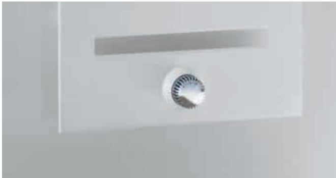
Completo Ausführung mit integriertem Ventil