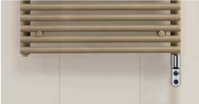
Ausführung Elektrobetrieb mit eingebauter Elektro-Heizpatrone DBM.